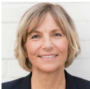
Glavni tajnik Marielle de Sarnez