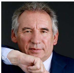
Predsjednik François Bayrou

Europska demokratska stranka, EDP, koju su 2004. godine osnovali François Bayrou i Francesco Rutelli, centristička je europska politička stranka koja okuplja političke stranke i zastupnike u Europskom parlamentu koji žele Uniju bližu građanima koji u njoj žive. Kao transnacionalni politički pokret, EDP namjerava izgraditi europsku demokraciju koja je ukorijenjena u zajedničkim vrijednostima mira, slobode, solidarnosti i obrazovanja, uz ambiciju da ponosno utvrdi svoju kulturu u budućem svijetu.