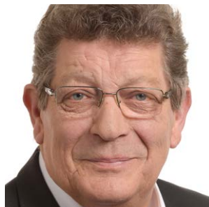
Glavni delegat Gérard Deprez